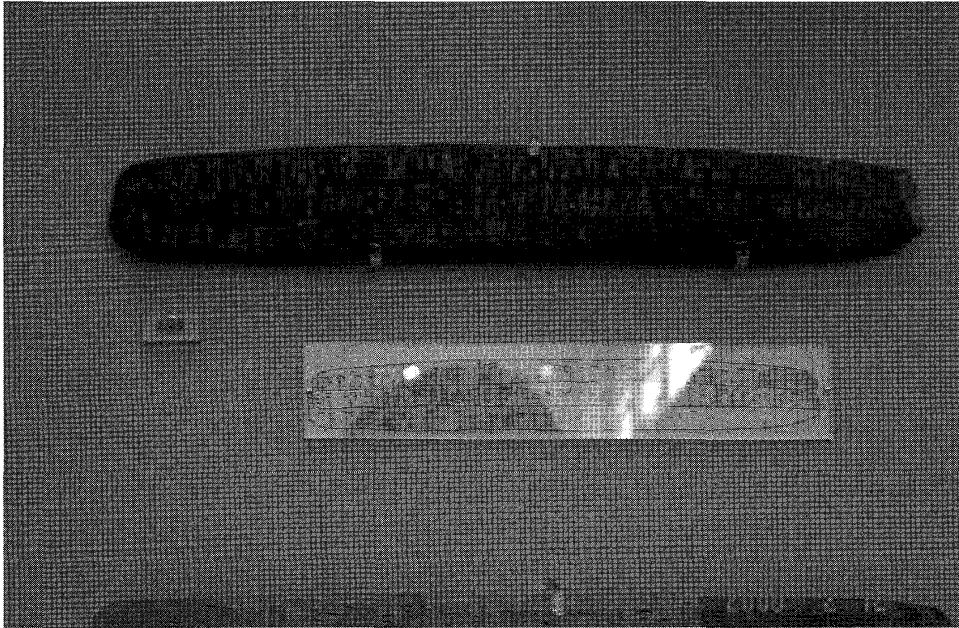
線文字 B の粘土板 (アテネ考古学博物館)

もった人々が住み、同心円状の輪によって構成された丸い島の伝説である。そしてこの島は、大地震と洪水のために一日と一夜のうちに海底に沈んでしまったのであった。 (9) この話は、古代ギリシャの哲学者プラトンが紀元前 360 年頃に書いたとされる『ティマオス』と『クリティアス』の中で、エジプトの神官が紀元前 6 世紀にギリシャの政治家ソロンに語ったものとして登場する。これが唯一のアトランティス自体について書かれた文献であり、謎はもちろんここから始まった。