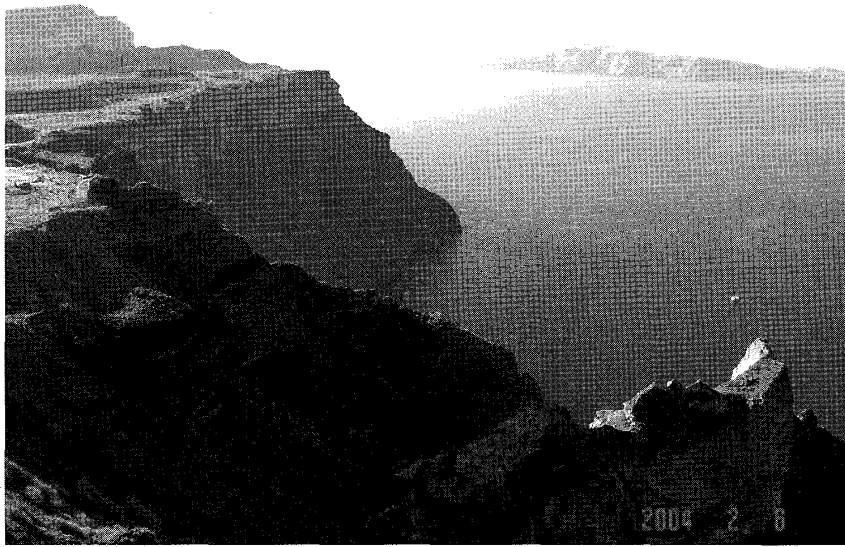
サントリーニ島（外輪山上の街フィラから内海を見る）